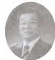
在基 前會長 월드컵 설명회 열다

前大宗會會長인 在基賢宗께서는 현재 한국관광협회 회 장으로 지난 5월 28일 잠실 롯데월드호텔에서 2002년 월드컵아시아지역 라이선싱 설명회를 열었다.