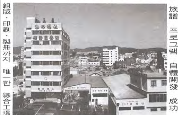
本社 社屋 全景