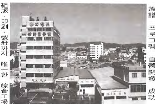
本社 社屋 全景