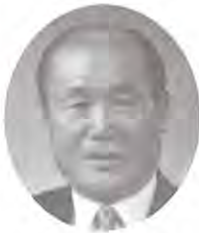
사회에 봉사하며 삽시다.