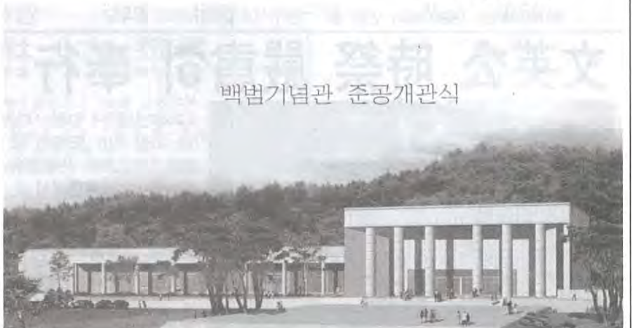
신축된 백범기념관 전경

在英 昌植 鴻洙 在甲 在坤 承會 台鎬 秀吉 光道 在熙 鳳會 廷秀 澄秀 在吉 泰成 泰燮 奎馨 南應 在鴻 昌會 在元 在均 會潤 魯振 鎰會 滿吉 在起 榮俊 吳植 太圭 泰英 泰哲 在光 永會 容世 圭冕 浩吉 容郁 鍾會 在成 聖會 鳳洙 弘植 爽卿 大浩