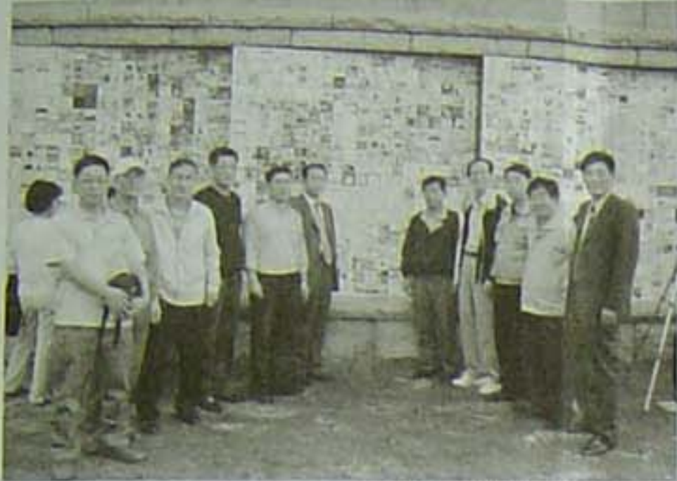
<벽화 앞에서 참석자 일동>

지난 10월 1일 안.사.연(안동김씨 사이버 학술 연구회)에서는 새롭게 복원된 청계천의 <소망의 벽>에 우리 문중 선조님의 詩文 15편을 타일 벽화로 제작하여 준영구 전시토록 하고, <청계천 새물맛이> 행사에 맞추어 이를 기념하는 조촐한 자축행사를 청계천에서 가졌다. 서울시에서 추진하여 47년만에