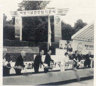
▲ 지난 6월 26일 추모제에 이어 백범기념관 건립기금식이 있었다.

우리나라 근대사에 인물이며 우리 안동김씨문중에 훌륭한 백범김구선생님이 서거하신지 51주년이 지난 지금에야 온국민의 성금과 정부의 보조금으로 선생님의 사상과 업적을 후세에 널리 알리기 위하여 기념관을 건립하오니 우리 안동김씨는 본 사업에 적극적으로 동참하여 백범선생의 훌륭한 업적을 빛내 주실 것을 부탁드립니다