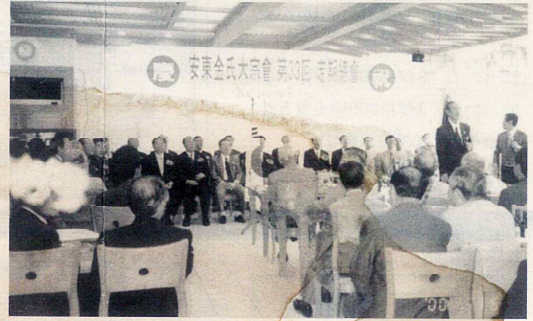
▲ 安東金氏大宗會 定期總會가 300여 宗인이 참석한 가운데 지난 5월 6일 개최되었다.

또한 안림사공파인 향진원에 대표 在均賢宗이 會議場을 빛내는 화한 1점을 기증하여 장식을 화려하게 하고 병목전회장이 회보발간에 경축하는 말씀으로 제31회정기총회 막을 내렸다.