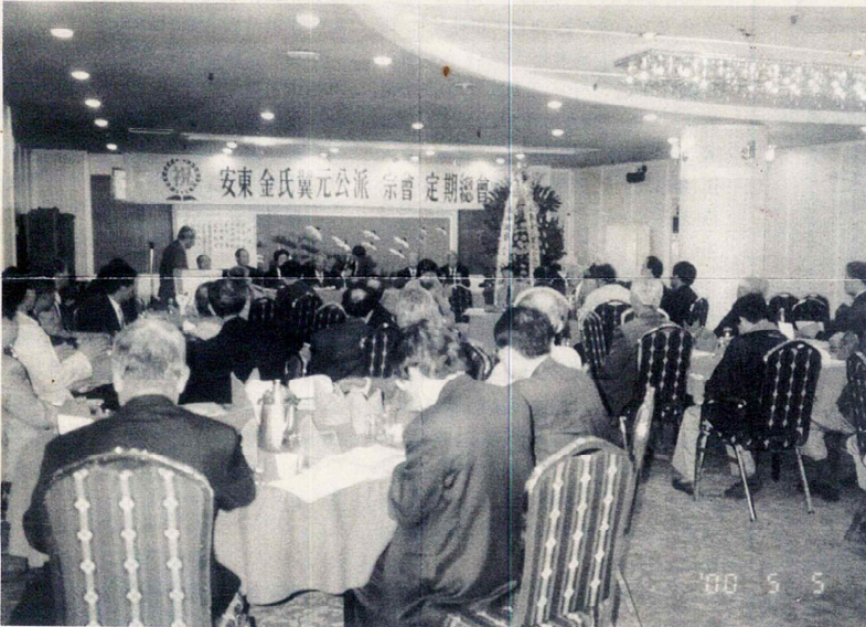
▲ 第31回 定期總會가 150餘宗人이 參席한 가운데 지난 5월 5일 大林1洞 태양의집에서 개최되었다.