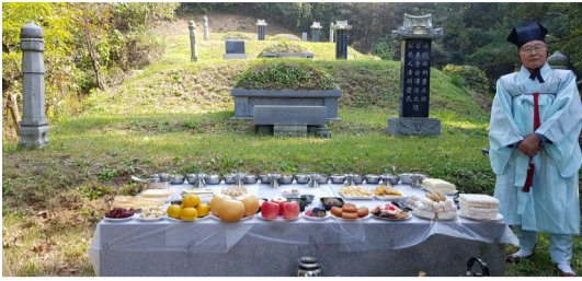
▲ 좌랑공 휘 담 설단

2019년10월27일(음9월 29일)11시 충남 아산시 도고면 오암리 산282-1번지 선영에서 재원 구담종회장 석한 대종회장 친인척 20여명이 참여한 가운데 좌랑공 諱淡 선